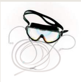
HYDROGEN BRILLE M. EAR-PLUGS