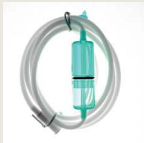
INHALERINGSSLANGE M. FUGTOPSAMLER