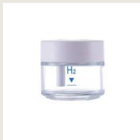
FUGTOPSAMLER I GLAS